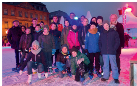
Auf der Eisbahn unterwegs.