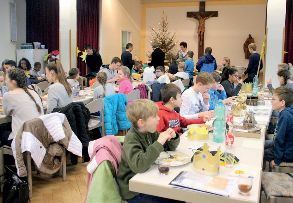
Sternsingen macht auch hungrig. Da können die Sternsinger ein Lied davon singen...