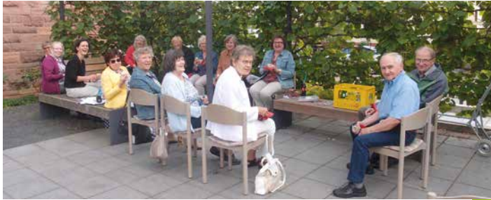
Die Gruppe beim zwanglosen Zusammensein auf dem Kirchplatz